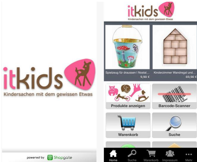
Screenshot, Shopping App iPhone/iPad, itkids Online Store