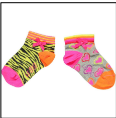
2er-Pack Kinder Sneaker Socken, Tarnmuster und Herzchen, Bio-Baumwolle, von LEBIG