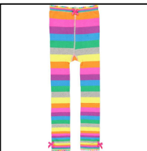
Strick-Leggings mit bunten Streifen, aus Bio-Baumwolle, von LEBIG