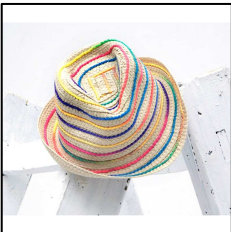
Lässiger Kinder Strohhut, von LEBIG