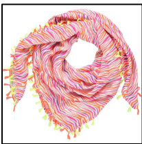
Halstuch mit Zebra Muster, 100% Viskose, bunt, von LEBIG

Auf Wunsch senden wir Ihnen gerne hochauflösendes Bildmaterial dieser oder weiterer Bilder.