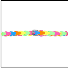
Kunterbunter Kinder Gürtel, in drei Längen, von LEBIG