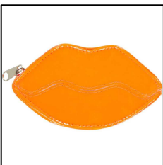
Ausgefallenes Kinder Portemonnaie in Lippenform, orange, von LEBIG