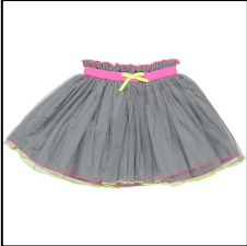
Niedlicher grauer Tüllrock / Tutu mit Baumwollfutter, von LEBIG