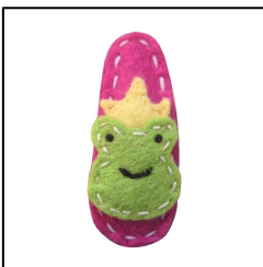
Haarspange Froschkönig "Frog Prince" von giddy giddy, aus Woll-Filz, für Big Girl