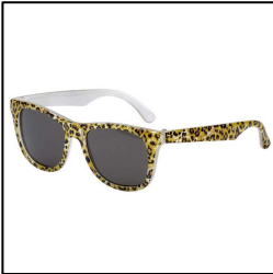
Sonnenbrille für Kleinkinder mit Tiger Muster, australischer Standard UV 400, 0 bis 3 Jahre, von Eyetribe