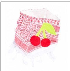
Kinder Halstuch "Pali Tuch" mit Fransen und Kirsche in Rot, von Farbgewitter