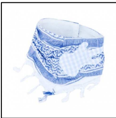
Kinder Halstuch "Pali Tuch" mit Fransen für Jungen, blau mit Gitarre, von Farbgewitter

Auf Wunsch senden wir Ihnen gerne hochauflösendes Bildmaterial und Freisteller Fotos dieser und weiterer Produkte.