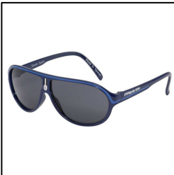
Piloten-Sonnenbrille für Jungen, blau, australischer Standard UV 400, 2 bis 8 Jahre, von Eyetribe